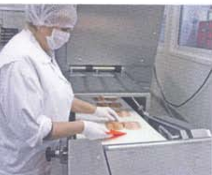
Der Slicer legt die Produkte gefächert ab./ The products are fanned in portions.

ly supplying the end customer with the company's own vending vehicles which ultimately helped the family-run company to success. Since then, the "Gollymobil", as it is known, has been providing consumers directly with the company's specialties and at fixed times. The end customers comprise mainly migrants with a Polish background.